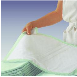
Krankenunterlagen mit Saugkörper aus Zellstoff-flocken.

Die saugstarken Krankenunterlagen mit den weichen Zellstoff-flocken.