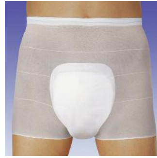
MoliMed for men protect umschließt den ge-samten Urogenitalbereich und gewährleistet so einen sicheren Rundumschutz auch bei stärkerem Urinverlust.

Die anatomisch geformte Einlage bei leichter Blasen-schwäche speziell für Männer.