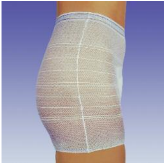
Elastische Höschchen zur Fixierung von Inkontinenzvorlagen.

Die hochelastischen und sicheren Fixierhöschen für Inkontinenzvorlagen.