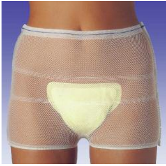
Anatomisch geformte Einlagen mit Dry-Plus-Vlies und Ultra-Saugkern.

Die anatomisch geformte Einlage bei leichter bis mittlerer Blasen-schwäche.