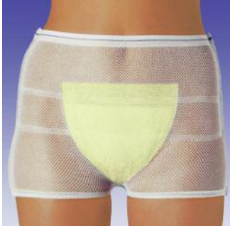
Saugkissen für die Inkontinenten- und Krankenpflege.

Das universelle Saugkissen für leichte Stuhlinkontinenz insbesondere bei Trägern von Dauerkathetern bzw. suprapubischen Kathetern.