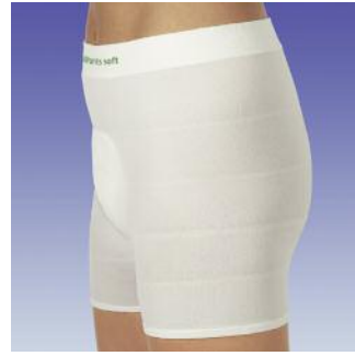
Besonders weiches und elastisches Höschchen zur Fixierung von Inkontinenzvorlagen.